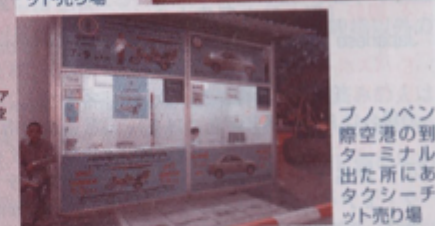
プノンベン国際空港の到着ターミナルを出た所にあるタクシーチケット売り場