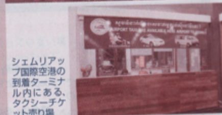
シェムリアップ国際空港の到着ターミナル内にある、タクシーチケット売り場