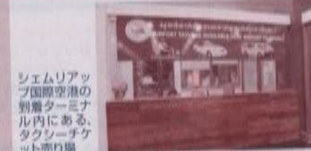
シェムリアップ国際空港の到着ターミナル内にある、タクシーチケット売り場