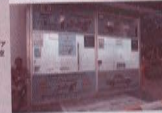
プノンベン国際空港の到着ターミナルを出た所にあるタクシーチケット売り場